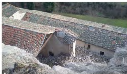
dopo la scossa di domenica 31 ottobre