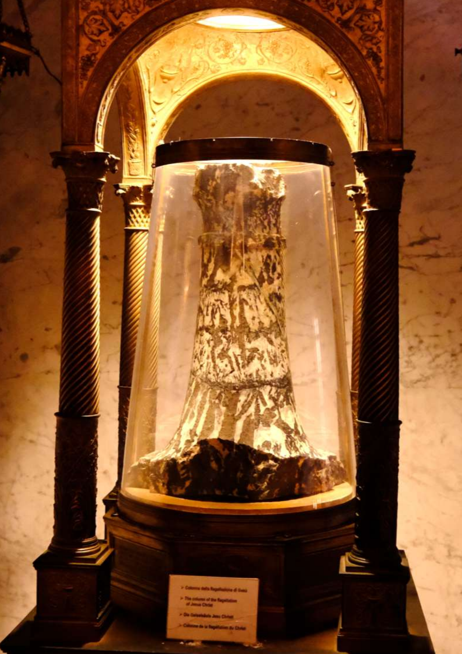
> Colonna della Resurrezione di Gesù > The column of the Resurrection of Jesus Christ > Die Auferstehungssäule von Jesus Christus > Colonne de la Résurrection de Jésus